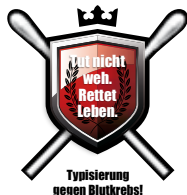
Die PRONOVA BKK informiert über Stammzellenspenden.