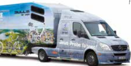
RUFA zeigt mit einem Aktions-Bus die neuesten Trends bei E-Bikes.