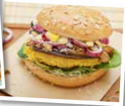
Kuchen und Burger sorgen für das leibliche Wohl.