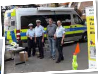
Die Dienststelle Verkehrsprävention der Polizei und die mobile Wache geben wertvolle Tipps zur Verkehrssicherheit.

Der ADAC ist mit einem trickreichen Fahrrad-Parcour vor Ort